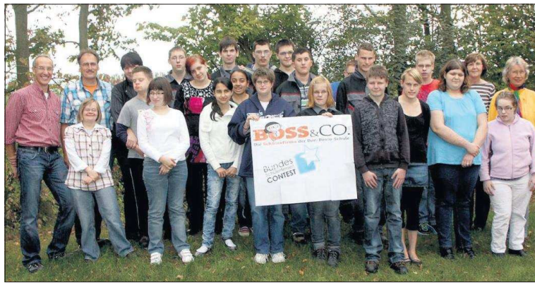
Zufriedene Gesichter – zu Recht: Die Schülerfirma der Don-Bosco-Schule hat bei einem bundesweiten Wettbewerb einen der ersten zehn Plätze belegt. Seit zehn Jahren erlernen die Jugendlichen in dem Projekt Arbeitstugenden wie Durchhaltevermögen und Qualitätsbewusstsein – als Vorbereitung fürs Berufsleben.

BÖKENFÖRDE ■ Das für dieses Wochenende geplante Erntedankfest des Heimatvereins Bökenförde fällt wetterbedingt aus. Der geplante Feldgottesdienst findet in der Dionysius-Kirche statt.