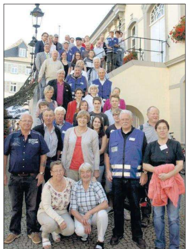
Beim Freiwilligentag in Lippstadt arbeiteten Udener und Lippstädter gemeinsam an ehrenamtlichen Projekten.