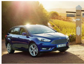
Der Ford Focus - Jetzt konfigurieren ( http://www.ford-focus-entdecken.de/?bannereu=olm-Q4-2016-Retail-plistaGmbH-Retail-standard-standard-local-640x360-Allgemein-Desire-plistaDE-plistanative-standard-de-RetailSalesQ4&referrer=plistaDE-plistanative )