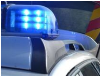
Drei Polizeibeamte bei Einsätzen in Trier und... ( http://www.volksfreund.de/4545970 )