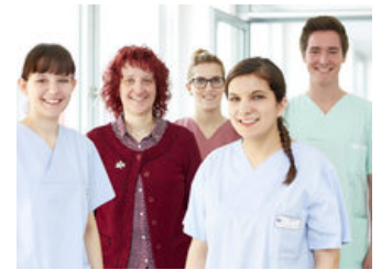
Kinderkrankenschwester in Nürnberg? ( https://www.klinik-hallerwiese.de/de/allgemeines/unternehme-pflegejobs/ )