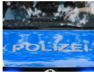
Betrunkener Mann uriniert an Thalfanger Tankstelle ( http://www.volksfreund.de/4546250 )